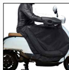
Un tablier de protection imperméable